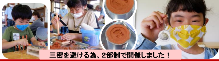
三密を避ける為、2部制で開催しました！

4か月ぶりの理科教室開催となりました！鑄物について学んだ後、自分で好きな模様の型を選び、指や棒を使って上型・下型それぞれに鑄物用の砂で型を取ります。出来た型を合わせ、そこにOBスタッフが約400度のホワイトメタルを型に流し込むのですが、トロトロに溶けた金属を見た子が「これ本当に金属？」と驚いていました。仕上げに、ヤスリでバリを削り、穴にストラップを通して鑄物のキーホルダーの完成☆久しぶりの教室に、子供達もOB達も笑顔が溢れていました♪