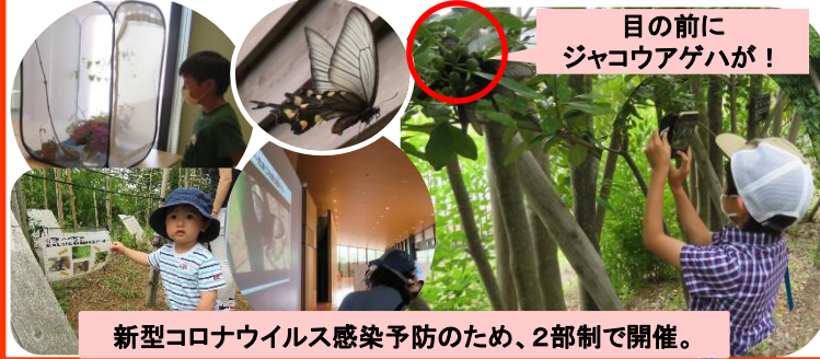
目の前にジャコウアゲハが！

こまつの杜で飼育観察を行っているジャコウアゲハ(蝶)とウマノズクサ(植物)を子供達に身近に感じてもらうため、室内にウマノズクサや卵、幼虫、蝶を展示しました。子供達は興味津々に観察し、屋外の蝶の観察エリアでは、飛んでいるジャコウアゲハをたくさん見ることができました。